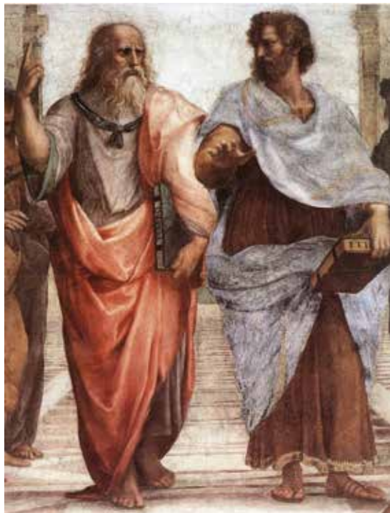
تصویر ۱. ارسطو فیلسوف اخلاقی، در نقاشی‌ای که رافائل کشیده است. افلاطون (چپ) به بالا اشاره می‌کند که برتری حقیقت اخلاقی جهانی را می‌رساند. در حالی که ارسطو (راست) به پایین اشاره دارد که مدعی اخلاق شرایطی است (اقتباس تصویر از ویلیام کانینگ‌هام و همکاران، ۲۰۱۲).

شادی یکی از اهداف اخلاق است و خوب می‌شود اگر بتوان با بحث علمی اخلاقی، به شادی شایسته‌تر یعنی از شادی گذرا؛ یعنی سعادت طولانی، رسید